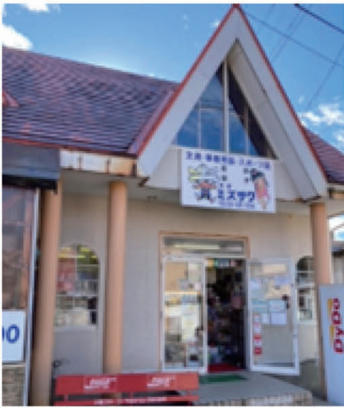
総業 74年 地域になくてはならないお店 ミズサワ