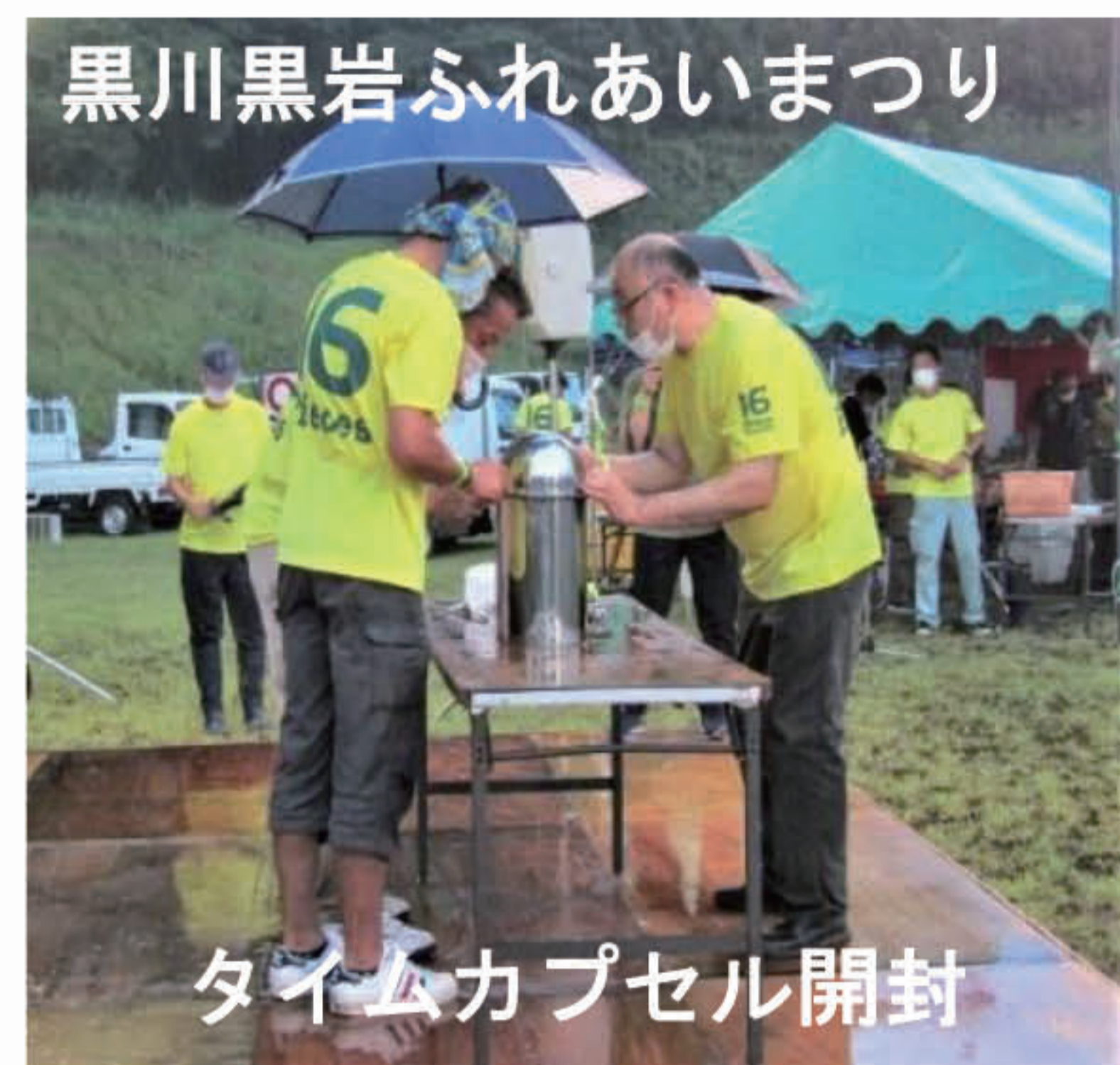
タイムカプセル開封

8月14日、旧黒川小学校グラウンドを会場に「黒川・黒岩ふれあいまつり」が開催されました。あいにくの雨模様となり、予定されたプロダラムの一部が取りやめになるなど、主催の16ピースは苦労の連続でした。それでも、黒川小学校閉校時に埋めたタイムカプセルが掘り起こされ、10年の時を超えて思い出がえりま