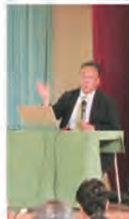
講演する鳥塚社長

た「鉄道のまち直江津」をテレビで見たときであり、このまちには鉄道が愛されている文化がある、そんなところで新しい鉄道を作ってみたいとの思いで社長就任を決意したとのこと。最近では「線路の石」を併詰にしての販売や、各種イベント列車やリゾート列車「雪月花」の運行。旧国鉄時代の455系・413系車両の導入。直江津操車場の転車台、SLの展示見学などさまざまなアイデアと仕掛けで集客努力が続けられています。