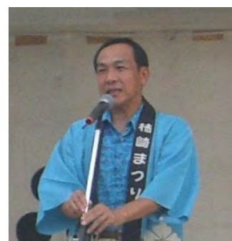
市長が開会式でご挨拶