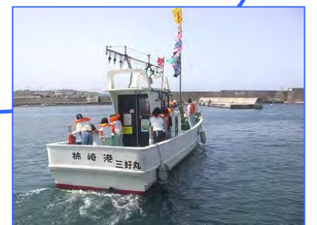
みなとさかな祭り