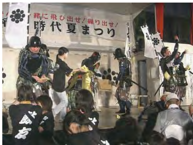
供果をふるまう武者のみなさん