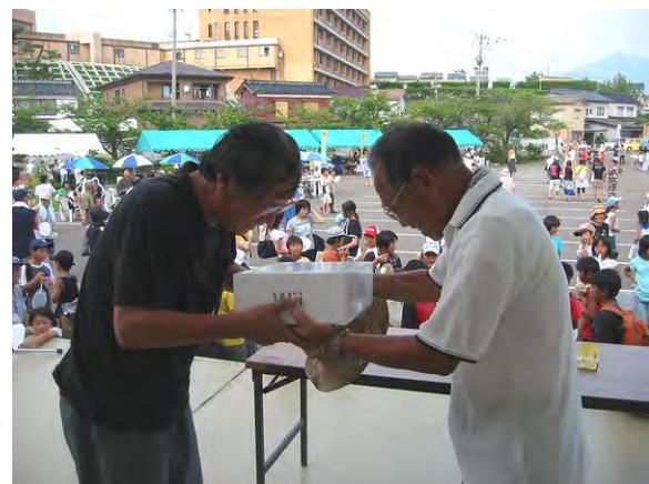
「大抽選会で見ごと」「任天堂 Wii」ゲット!