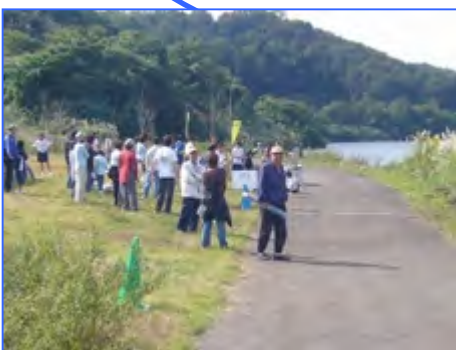
ダムっ湖フェスティバル