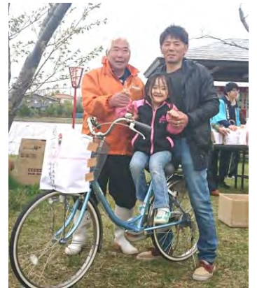
写真…ビンゴゲーム優勝者

15日は恒例の大ビンゴゲーム大会があり、また、ヒップホップダンスやよさこいソーラン、和太鼓演奏等、様々な催しで来場者を楽しませてくれました。