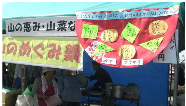
牧区からも山菜鍋の出店参加を していただきました