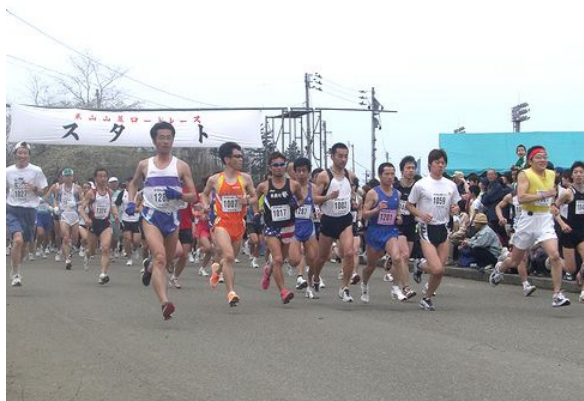
風と緑のパノラマロード 米山麓ロードレース