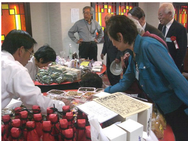
いつも心に故郷あり 東京柿崎会総会

6位ににゆうしようして、ひようしよう台上がったら、ちよっときんちようしたけど、またがんばって3キロコースを走ってみたいと思いました。