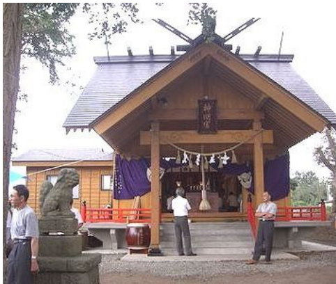
昨年秋に完成した、上下浜神社

お詫び：前号での記載内容中、作者のご了解を得ずに加除してしまった部分があり、改めてご本人の原文をご紹介させていただきます。