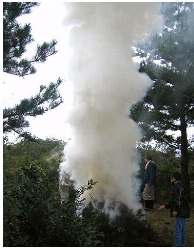
右の写真が特別賞受賞作品

その様子をカメラに収め、狼煙プロジェクトに出展したところ、特別賞をいただく事になり、2月2日、新潟チサンホテルの授賞式にネット柿崎の会員4人で出席し、感動を新たにしてみました。