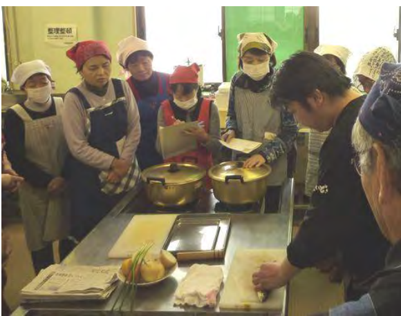
真剣に講師の手元を見つめる参加者