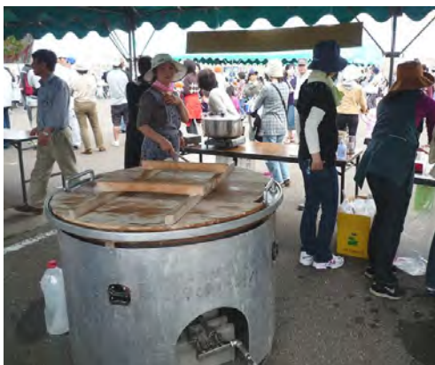
食推・商工会女性部の大鍋

なべ輪ピックでは3つの鍋が販売されましたが、見事「金なべ賞」を受賞したのは、食推・商工会女性部の「田舎風ニョキニョキ鍋」でした。 『今年はタケノコの成長が遅く、当日に間に合うか心配しましたが、なんとか手に入れ、おいしいタケノコ汁を作ることができました。 前日から仕込んだ鍋は、味が染みて美味さも倍増！あつという間に完売となりました。 部員の皆様、関係者の皆様、ありがとうございます。』