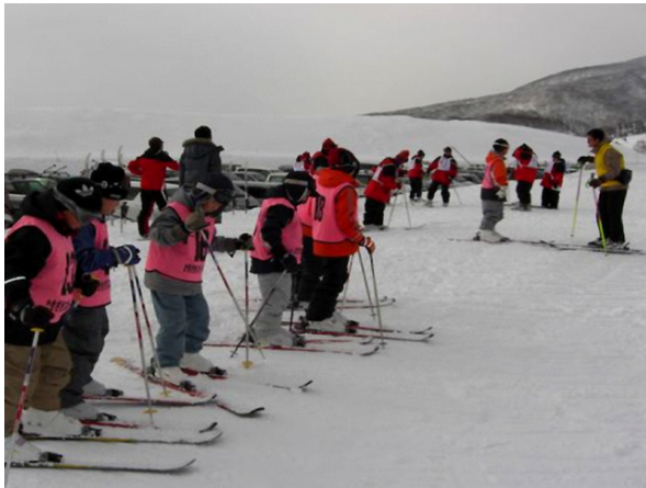
スキー教室の子どもたち