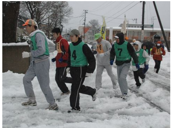
雪の中を走る選手たち