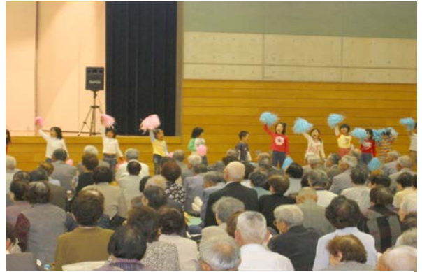
「かわいいね～」とほころぶ参加者たち

本年度、上越市から事務委託を受け、柿崎まちづくり振興会が中心となり、企画・進行に当たりました。振興会の理事をはじめ地元ボランティアの皆様、そして総合事務所の福祉グループからご協力をいただいで実施いたしました。 当日は、四百五十名の皆様から参加をいただき、第一保育園の園児からは「カレーのロックンロール」と「えい・やあ・さあ!」の2曲のお遊戯を披露していただき、拍手喝采の大盛況でありました。